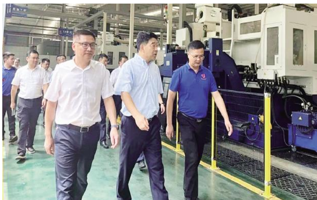
▲柯副省长一行在公司现场参观

8月16日上午,浙江省副省长柯吉欣莅临今飞凯达轮毂股份有限公司考察调研,金华市副市长李斌峰,金华经济开发区党工委书记、管理委员会主任王建中等金华市政府相关领导陪同调研。今飞凯达轮毂股份有限公司总裁张建功、智能工厂厂长唐志斌全程接待。