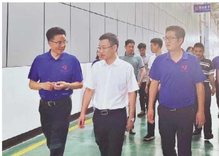
▲金华市副市长章旭升一行在公司现场参观