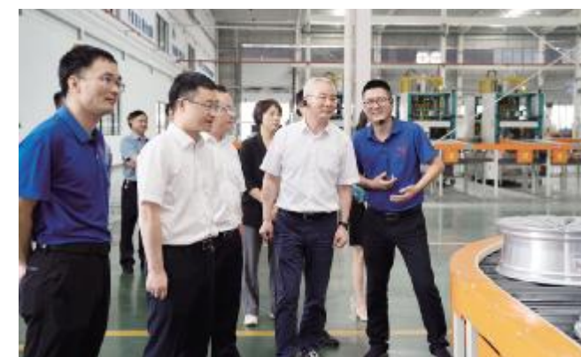
▲吴书记一行在公司现场参观

8月31日上午,省科协党组书记吴晓东一行莅临今飞凯达轮毂股份有限公司参观考察。今飞集团总工程师李文彩、今飞凯达轮毂股份有限公司厂长唐志斌热情接待了吴书记一行,并陪同参观了车间生产现场及今飞国家企业技术中心。